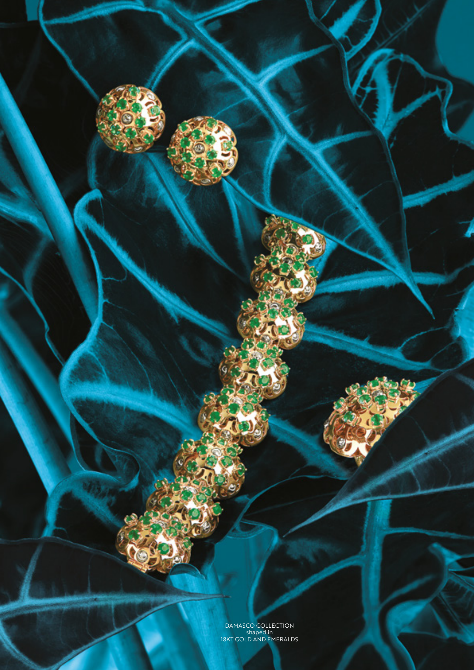
DAMASCO COLLECTION shaped in 18KT GOLD AND EMERALDS