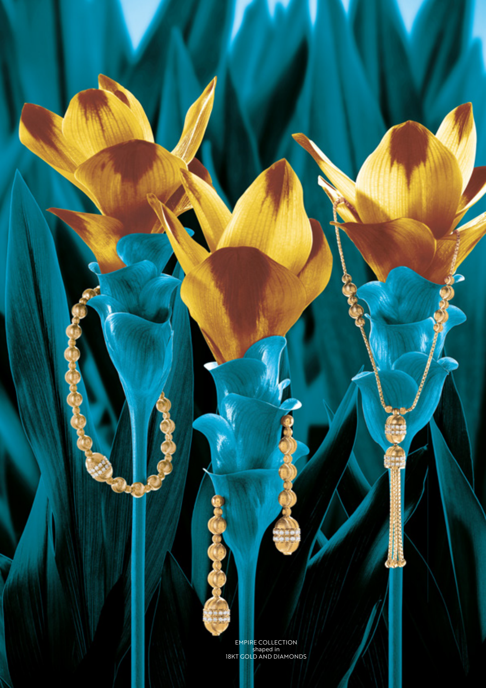
EMPIRE COLLECTION shaped in 18KT GOLD AND DIAMONDS