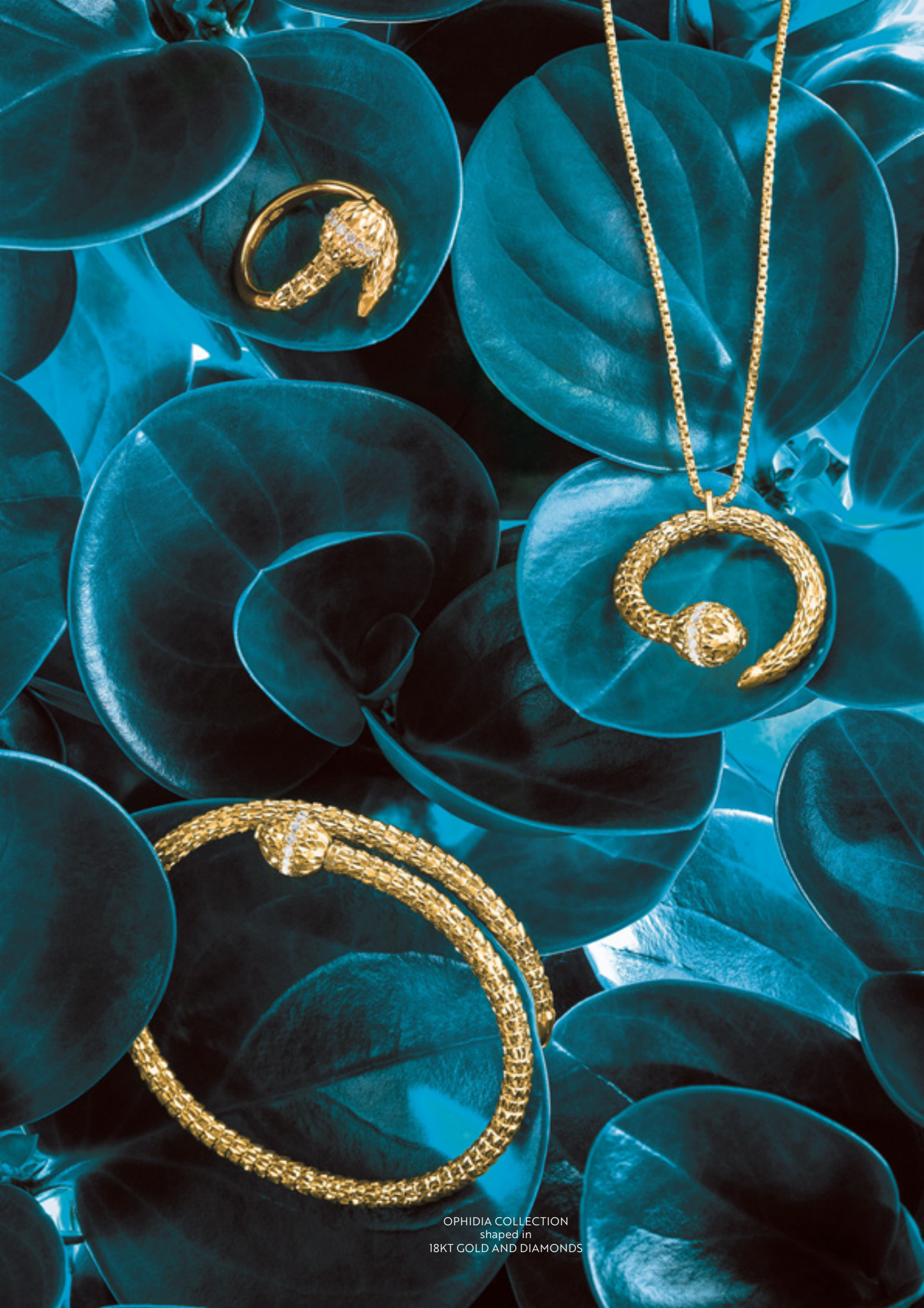
OPHIDIA COLLECTION shaped in 18KT GOLD AND DIAMONDS