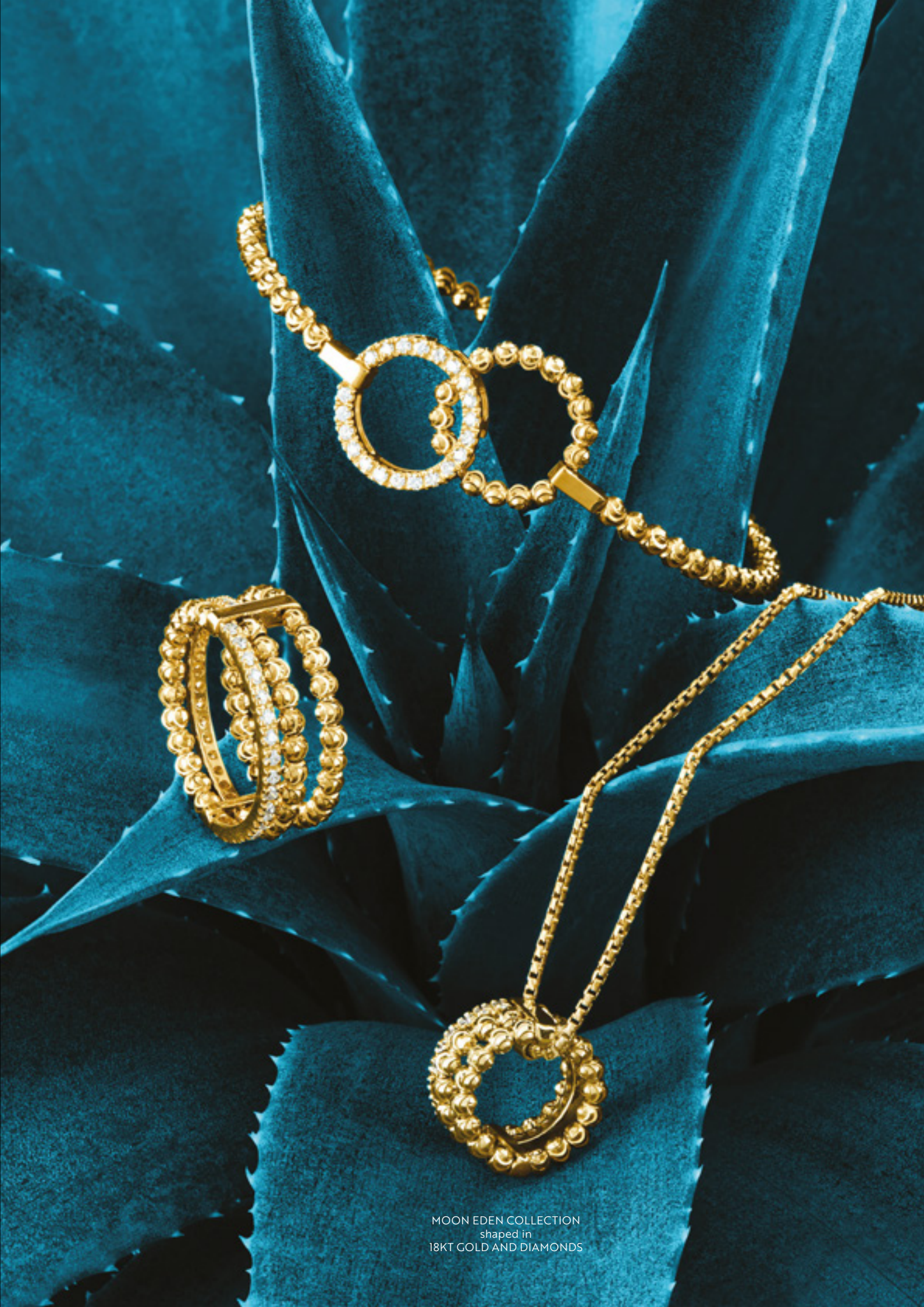
MOON EDEN COLLECTION shaped in 18KT GOLD AND DIAMONDS