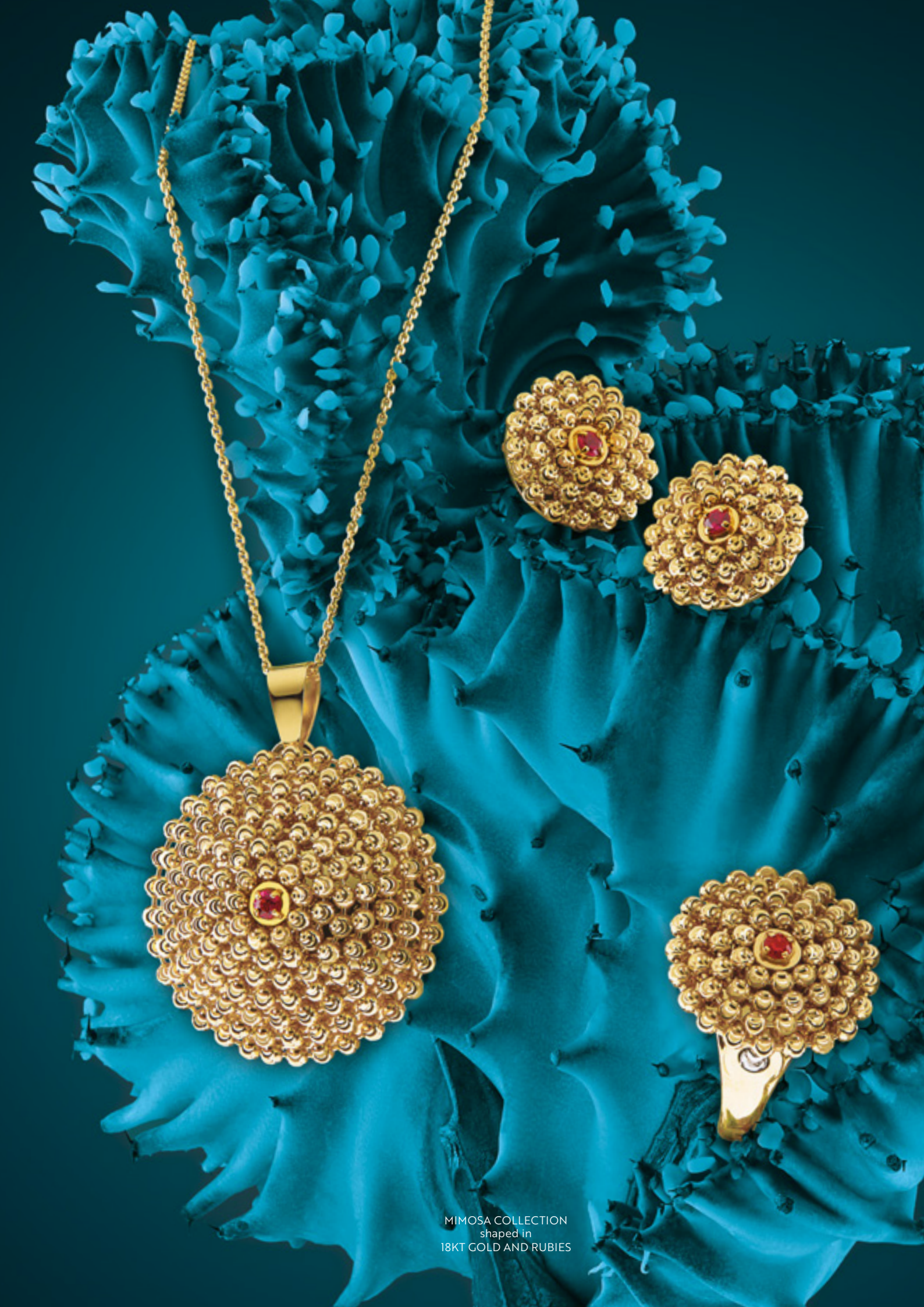
MIMOSA COLLECTION shaped in 18KT GOLD AND RUBIES