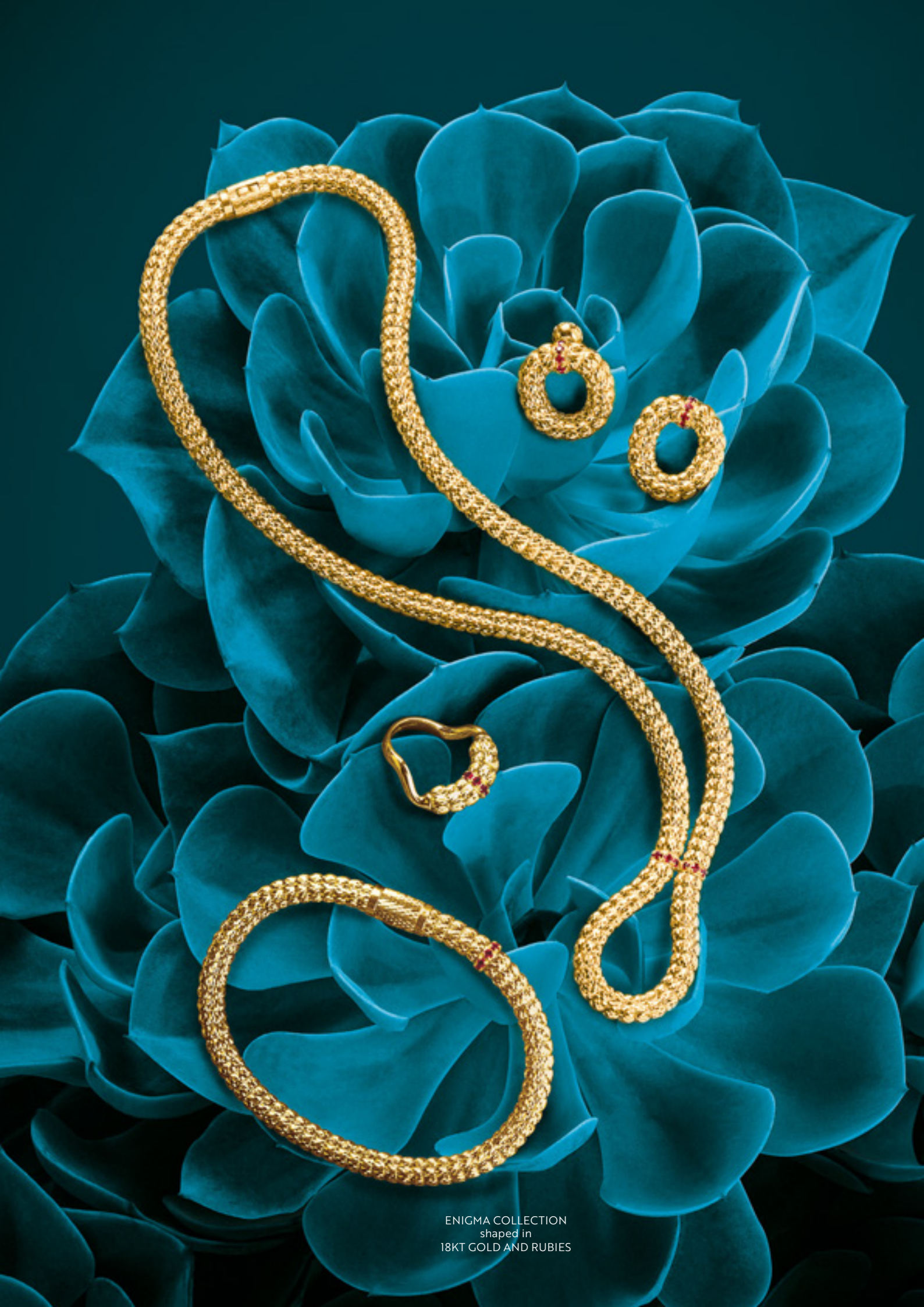
ENIGMA COLLECTION shaped in 18KT GOLD AND RUBIES